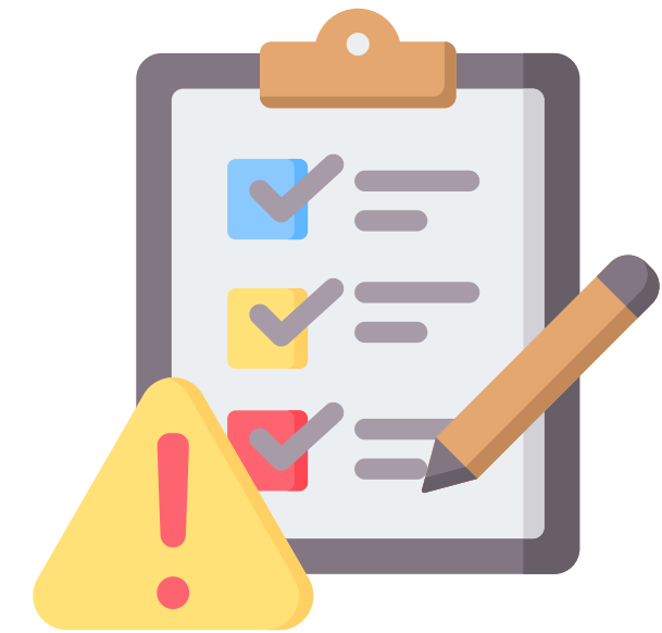
Dispositif de signalement